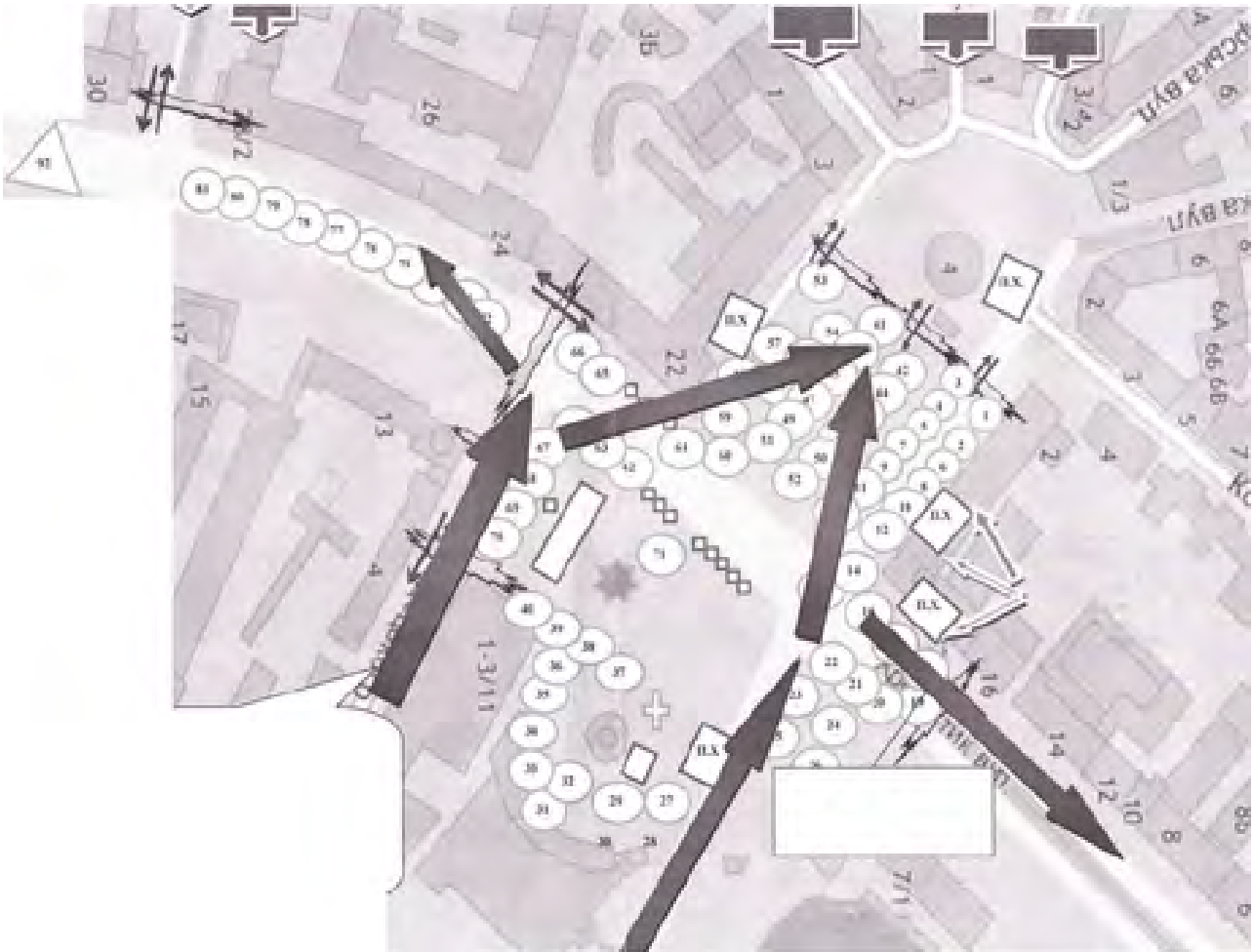
План операції "Бумеранг". Із матеріалів, оприлюднених Геннадієм Москалем на сайті moskal.in.ua

Внаслідок подій 19 лютого у Києві тілесні ушкодження різного ступеня тяжкості отримали 156 беззбройних активістів. З них 23 отримали вогнепальні поранення (три з яких виявилися смертельними), троє померли від інших травм. Крім цього, тілесні ушкодження різного ступеня тяжкості отримали 105 правоохоронців, 15 з них отримали вогнепальні поранення, одне з яких призвело до смерті.