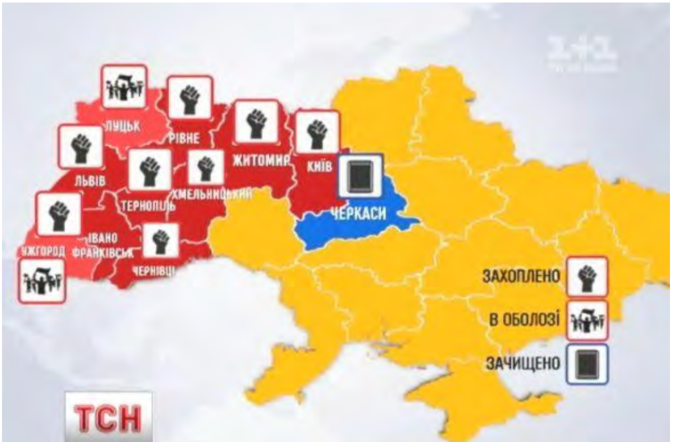
Карта України з позначенням міст, в яких було захоплено чи оточено активістами будівлі державних адміністрацій, станом на 24 січня 2014 року.