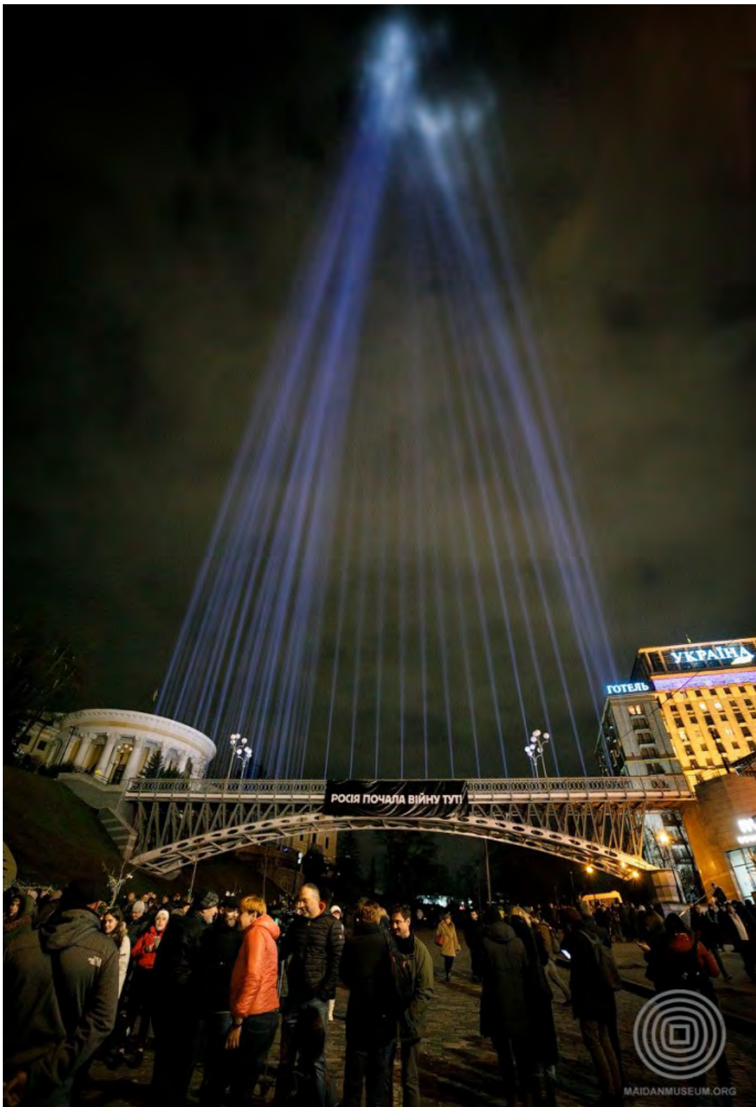
Промені Гідності. Із колекції НМРГ

“Мальви пам’яті” . Цю акцію, присвячену Героям Небесної Сотні та воїнам російсько-української війни, започатковано Музеєм у травні 2020 року до Дня Героїв. 23 травня 2020 року біля портретів загиблих учасників Революції Гідності на алеї Героїв Небесної Сотні та вздовж стіни пам’яті біля Михайлівського собору було викладено паперові мальви, зроблені родичами загиблих.