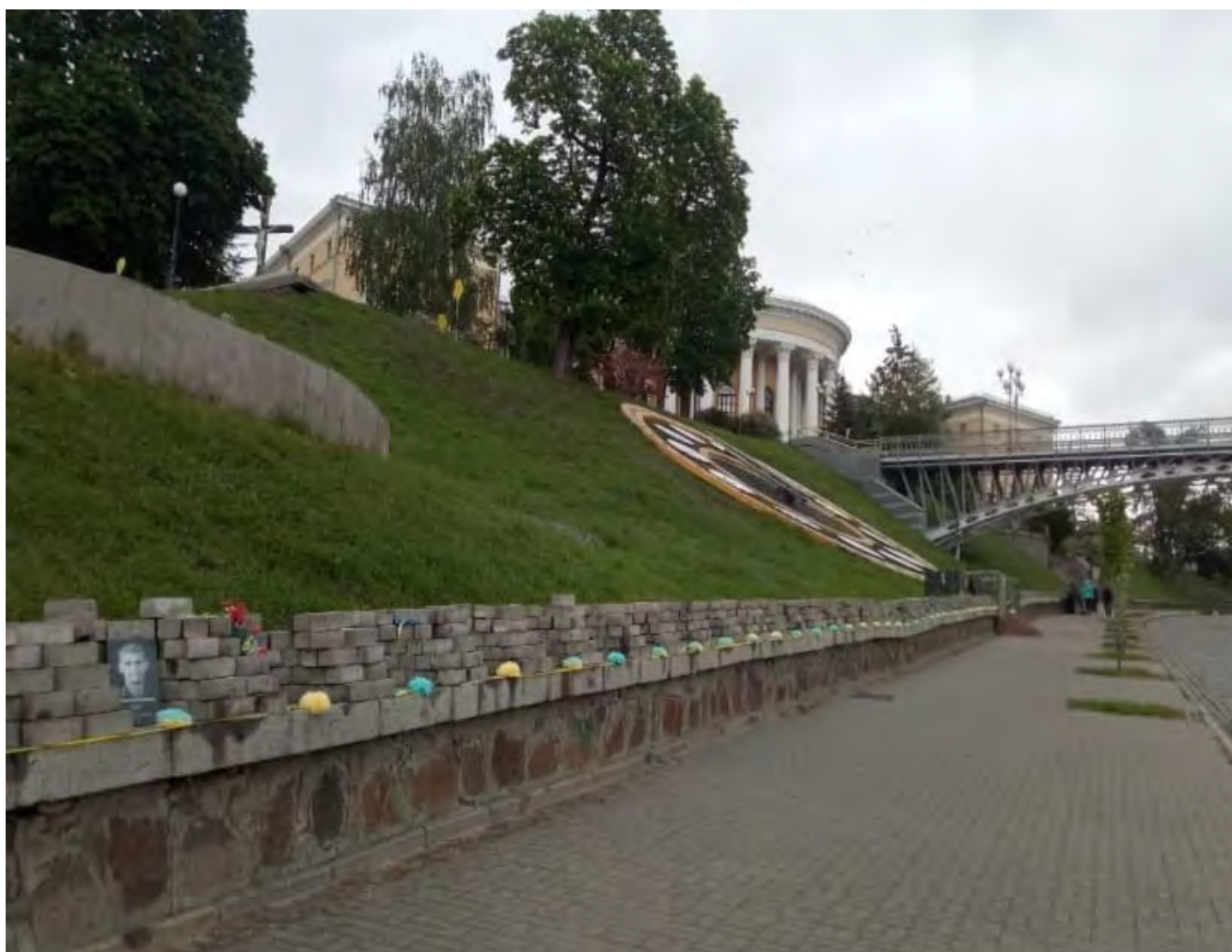
Мальви пам'яті на алеї Героїв Небесної Сотні. Із колекції НМРГ

“Іриси пам'яті” . У серпні 2020 року Музей Революції Гідності разом з Українською спілкою ірисів та київським осередком громадської організації “Родина Героїв Небесної Сотні” організували висаджування спеціального сорту ірисів, присвяченого Героям Небесної Сотні, який вивів селекціонер Геннадій Мамченко. Ірисами цього сорту уквітчали пам'ятні місця в Києві та інших містах і регіонах України, зокрема на території Михайлівського собору, на алеї Героїв Небесної Сотні, у сквері імені Володимира Мельнічука в Києві, на алеї Героїв Небесної Сотні в Обухові на Київщині, біля пам'ятників Героям Небесної Сотні у Миколаєві й на Тернопільщині.