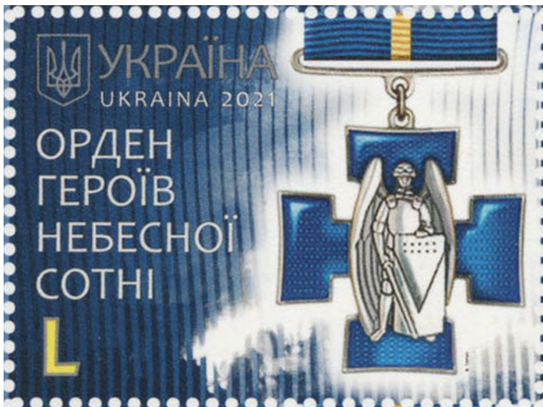
Поштова марка "Орден Героїв Небесної Сотні.