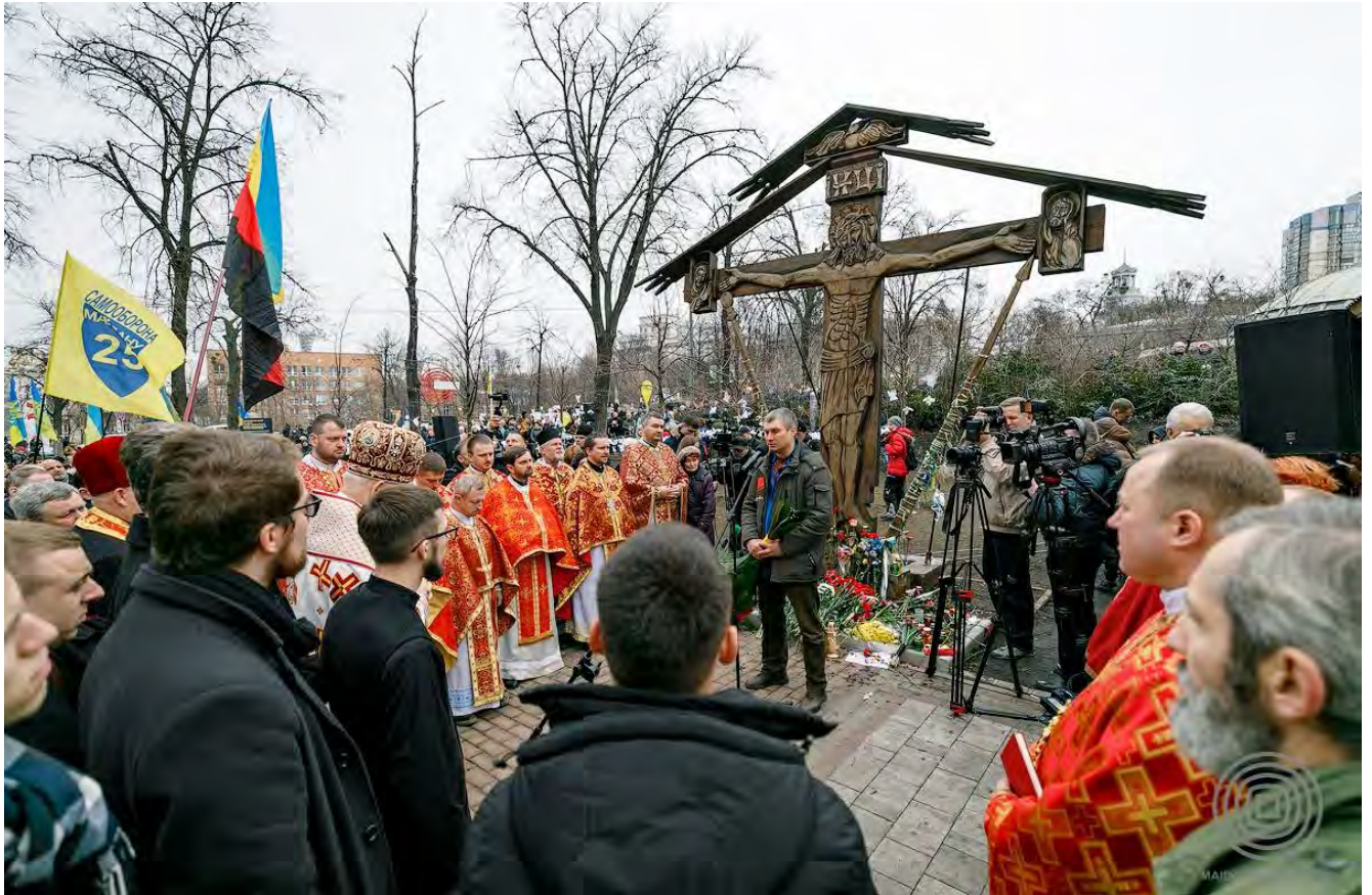
Поминальна служба біля хреста на алеї Героїв Небесної Сотні.

ініційовано родинами Героїв Небесної Сотні. У межах заходу задля вшанування загиблих до пам'ятних місць кладуть різдвяні вінки, сплетені напередодні. Тиху акцію "Ангели пам'яті", присвячену Небесній Сотні, ініціювали громадська активістка та співачка Анжеліка Рудницька й мистецька агенція "Територія А". Паперових ангелів розвішують у пам'ятних місцях не лише в Україні, а й за кордоном.