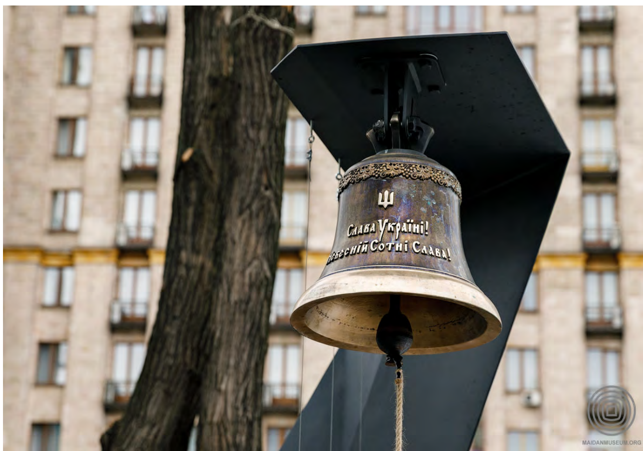
Дзвін Гідності на алеї Героїв Небесної Сотні у Києві. Із колекції НМРГ

Цей комеморативний проєкт, ініційований Національним музеєм Революції Гідності, має на меті привернути увагу широкої громадськості до подвигу кожного з Героїв Небесної Сотні. Проєкт започатковано 1 січня 2021 року. Для його реалізації виготовлено 70-кілограмовий Дзвін Гідності за зразками тональних комплексів дзвонів, які встановлено в церквах Києва, а один із них, той, що на подвір’ї Міністерства оборони, вшановує захисників України, які загинули внаслідок російської збройної агресії. На Дзвоні Гідності зроблено напис “Слава Україні! Небесній Сотні Слава!”