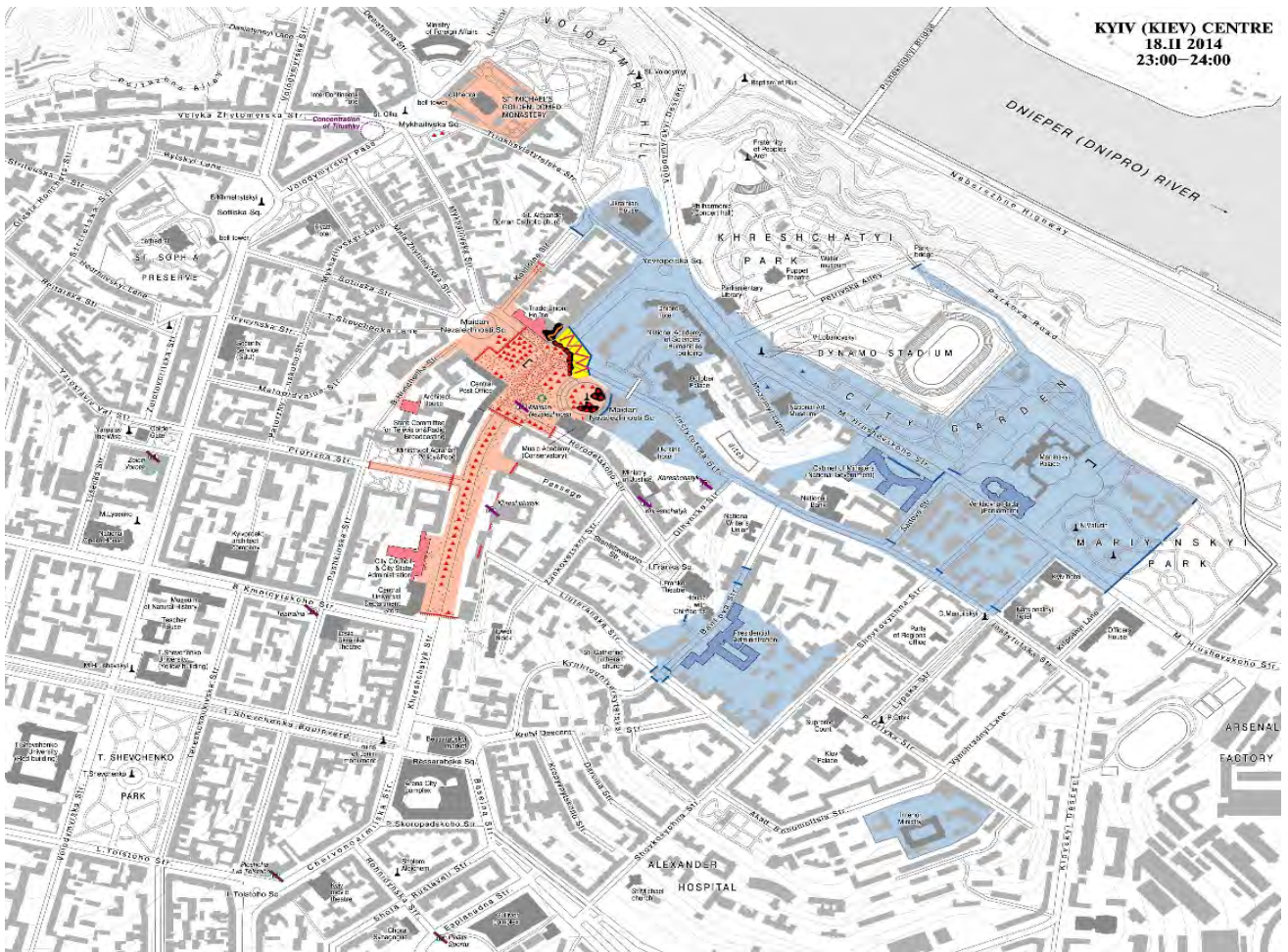
Карта середмістя Києва з розстановкою сил станом на 23:00 18 лютого 2014 року. Рожевим кольором позначено територію Майдану, блакитним – розташування силовиків, чорним – вогняні барикади та намети. Автор карти Дмитро Вортман.